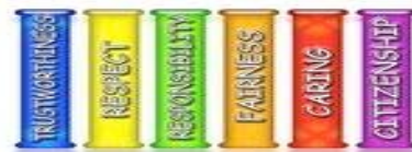
The Six Pillars of Character

La Primaria Tarpey tiene un sobresaliente programa de El Carácter Cuenta. Aquí en Tarpey nuestro personal docente anima a nuestros estudiantes a vivir sobre los Seis Pilares de el Carácter Cuenta. Cada mes nuestros maestros enfocan uno de los seis pilares, y los estudiantes reciben premios mensuales demostrando buen carácter. Por favor pregunte a su niño/a sobre el Carácter Cuenta, y la semana de el Carácter Cuenta.