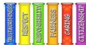
The Six Pillars of Character

Lunes ~ vestirse de Azul ~ Confianza Martes ~ vestirse de Amarillo ~ Respeto Miércoles ~ vestirse de Verde ~ Responsabilidad Jueves ~ vestirse de Anaranjado ~ Justicia Viernes ~ vestirse de ~ Rojo ~ Cuidado