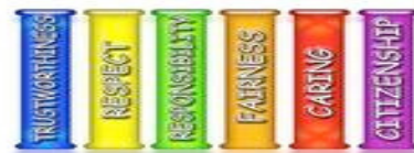
The Six Pillars of Character

La Primaria Tarpey tiene un sobresaliente programa de El Carácter Cuenta. Aquí en Tarpey nuestro personal docente anima a nuestros estudiantes a vivir sobre los Seis Pilares de el Carácter Cuenta. Cada mes nuestros maestros enfocan uno de los seis pilares, y los estudiantes reciben premios mensuales demostrando buen carácter. Por favor pregunte a su niño/a sobre el Carácter Cuenta, y la semana de el Carácter Cuenta.