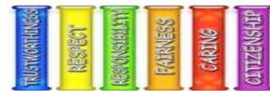
The Six Pillars of Character