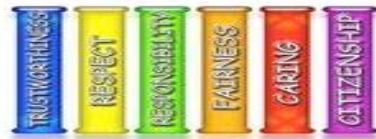
The Six Pillars of Character

La Primaria Tarpey tiene un sobresaliente programa de El Carácter Cuenta. Aquí en Tarpey nuestro personal docente anima a nuestros estudiantes a vivir sobre los Seis Pilares de el Carácter Cuenta. Cada mes nuestros maestros enfocan uno de los seis pilares, y los estudiantes reciben premios mensuales demostrando buen carácter. Por favor pregunte a su niño/a sobre el Carácter Cuenta, y la semana de el Carácter Cuenta.